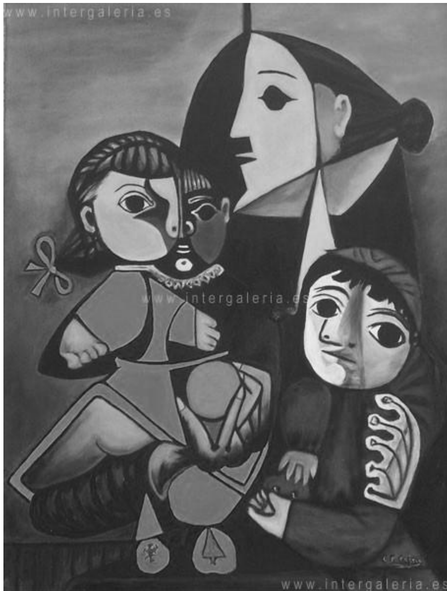
La familia – Pablo Picasso

Después de ver la película Abel , estudia la pintura. Luego compara la representación de la familia en las dos obras.